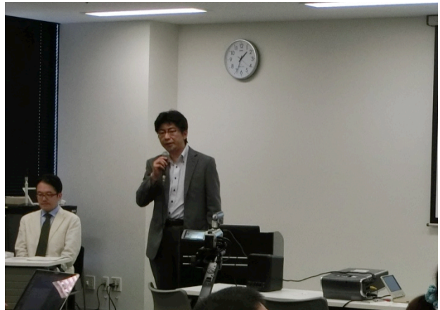
主催者あいさつ（日本文化人類学会総務理事）