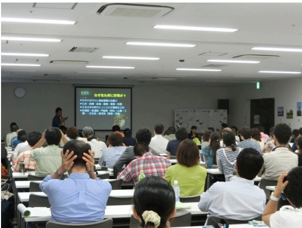
パネリストの発表